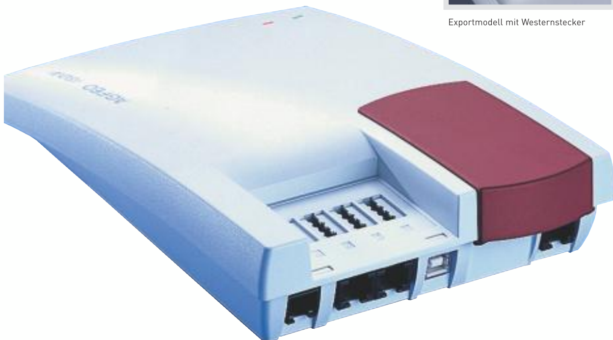
Exportmodell mit Westernstecker