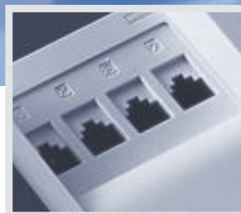
Die AGFEO AC 141 WebPhonie plus ist auch wandmontagefähig.